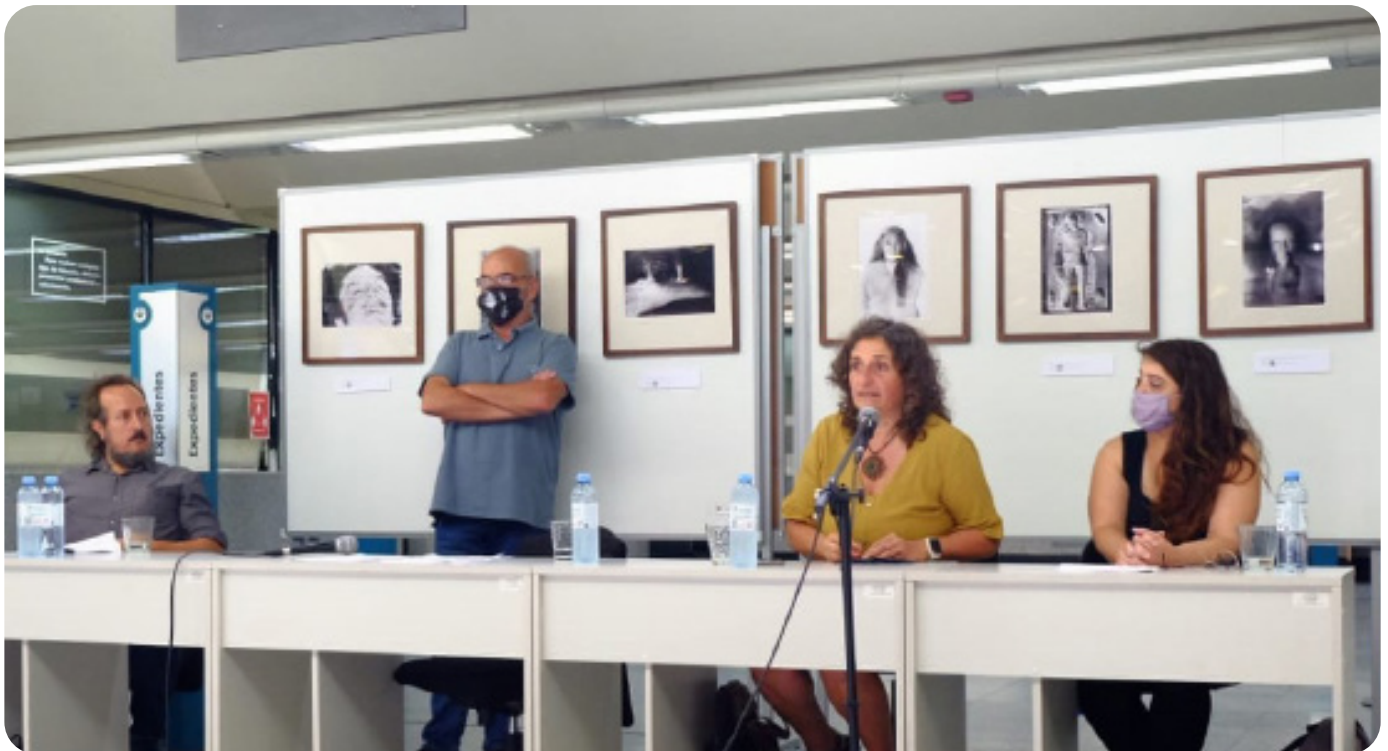
Octubre 2022. Mes del "Respeto a la Diversidad Cultural". Charla a cargo del Grupo Universitario de investigación en Antropología Social (GUIAS)