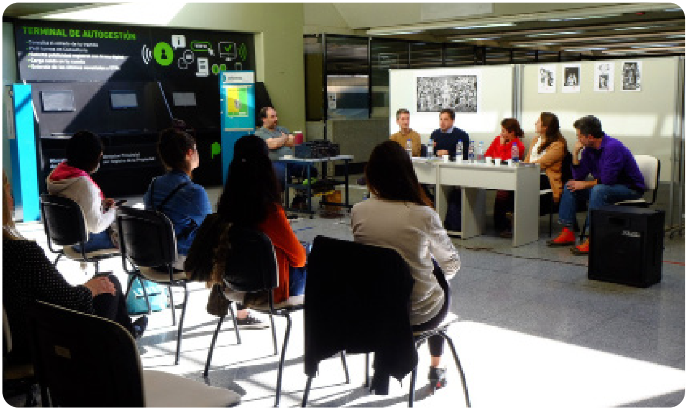
Agosto 2022. Mes de las Infancias. Charla “Niñez y Derechos Humanos” a cargo del Programa Niñez, DDHH y Políticas Públicas de la Secretaría de Extensión de la Facultad de Ciencias Jurídicas y Sociales (UNLP).