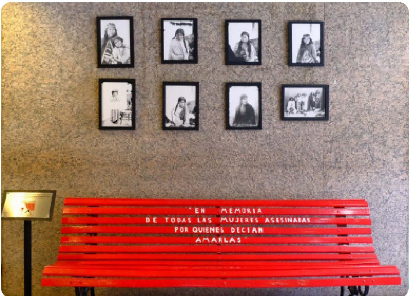
Octubre 2022. Mes del "Respeto a la Diversidad Cultural". Muestra "Prisonerxs De La Ciencia" organizada por Marcos Bufano, fotógrafo del grupo GUIAS.