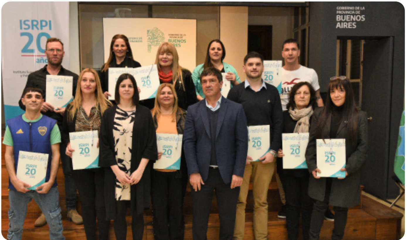
Agosto 11 de 2023. Acto Aniversario 20° ISRPI. Entrega de títulos Segunda Cohorte Tecnicatura Superior en Registración y Publicidad Inmobiliaria