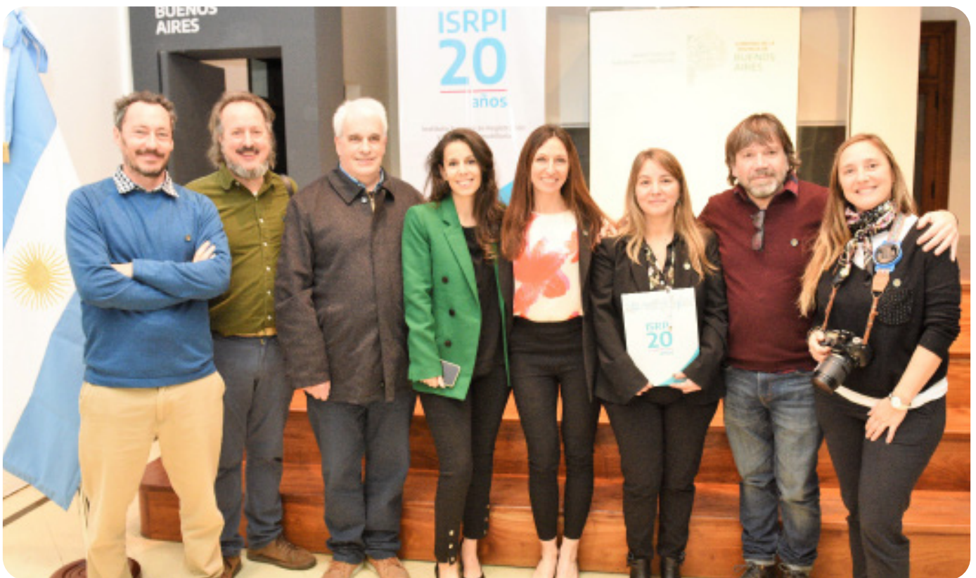
Equipo Instituto Superior de Registración y Publicidad Inmobiliaria